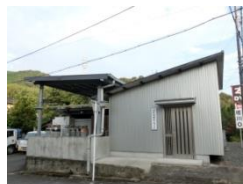
株式会社 佐川酸素 光支店

本社 〒742-0032 柳井市古開作541-1 TEL 0820-22-0261 FAX 0820-72-0199