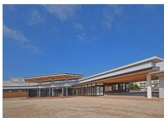
最近の実績 室積コミュニティセンター