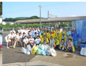
7月 光市クリーン計画(光駅周り清掃)