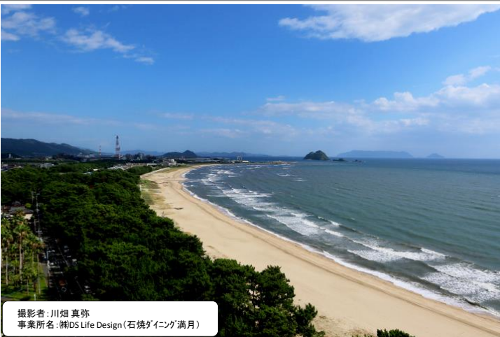
撮影者:川畑 真弥 事業所名:株式会社DS Life Design(石焼ダイニング満月)

編集・発行/光商工会議所青年部 本通信に関するお問い合わせ(光商工会議所)/電話:0833-71-0650 メール:i-love@hikari-cci.jp