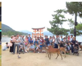
7月 家族会(宮島日帰り旅行)