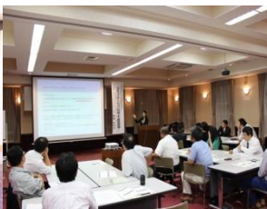
6月 コミュニケーション向上セミナー