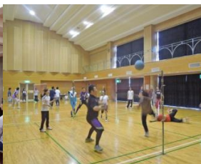
6月 社員交流会(ソフトバレー・体力測定)