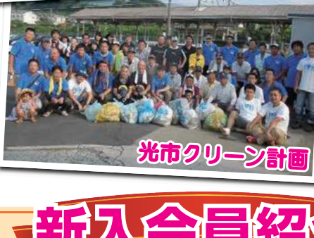
光市クリーン計画