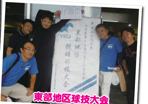
東部地区球技大会