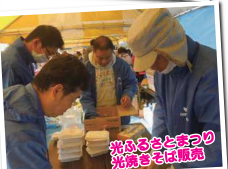
光ふるさとまつり 光焼きそば販売