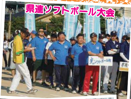
県連ソフトボール大会